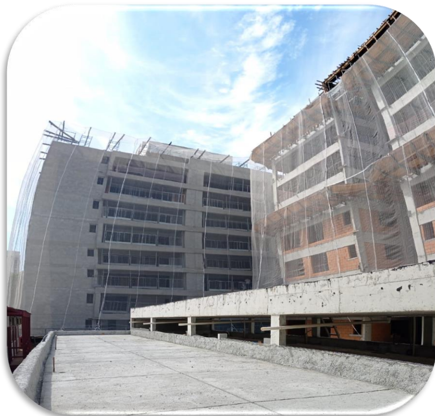
Vista das torres A e B