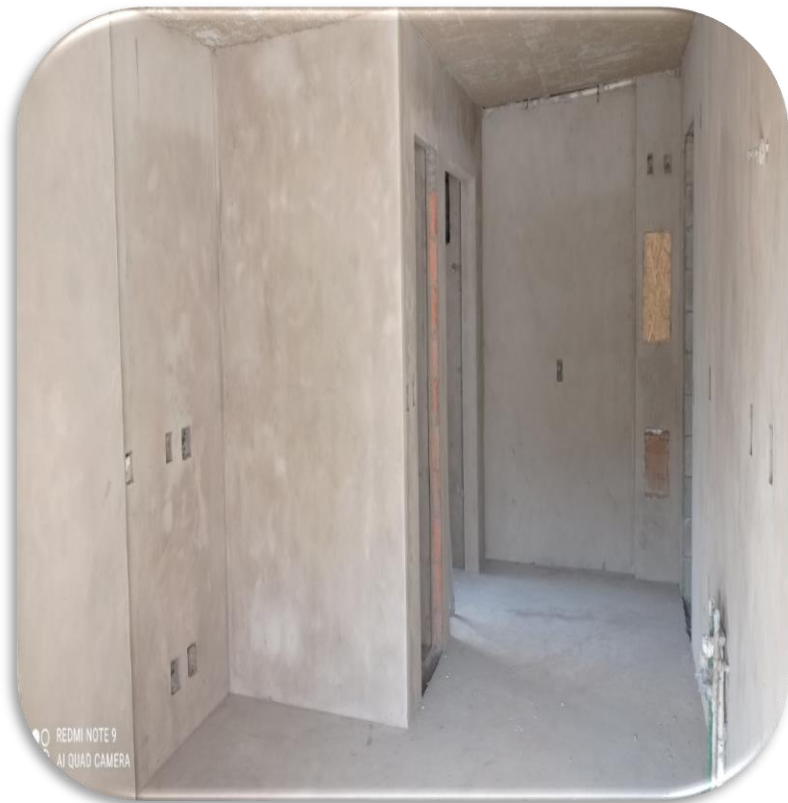
Revestimento em massa Torre A