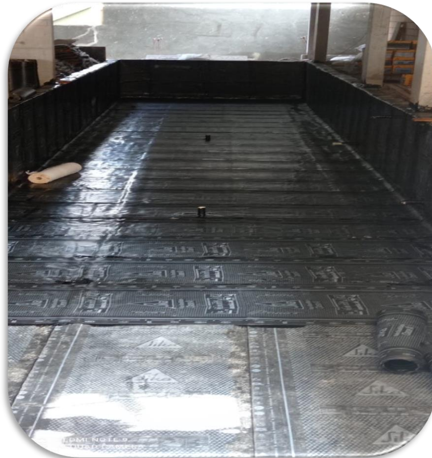
Impermeabilização de piscina coberta com ( manta dupla )