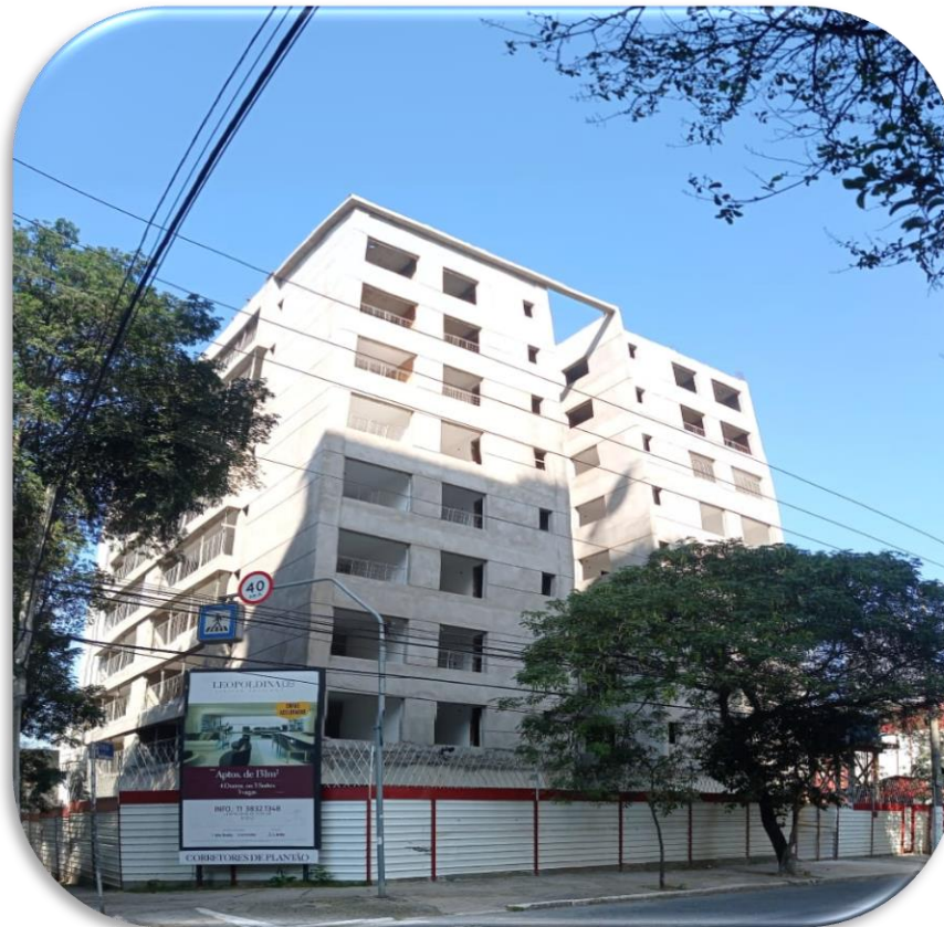
Vista da fachada Torre A