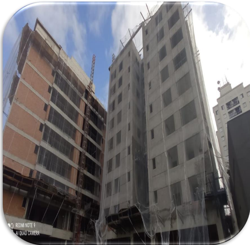
Vista das fachadas TORRE A e B